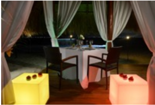
Cena Romantica 2- 10 huespedes.