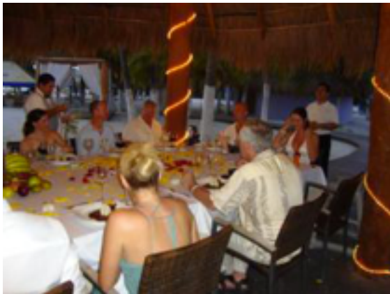
Grupos 10+ invitados