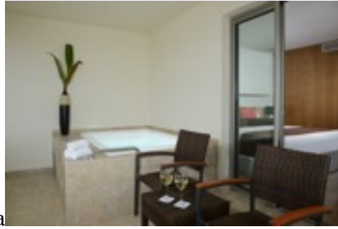
Superior Room con tina estilo Jacuzzi en la terraza